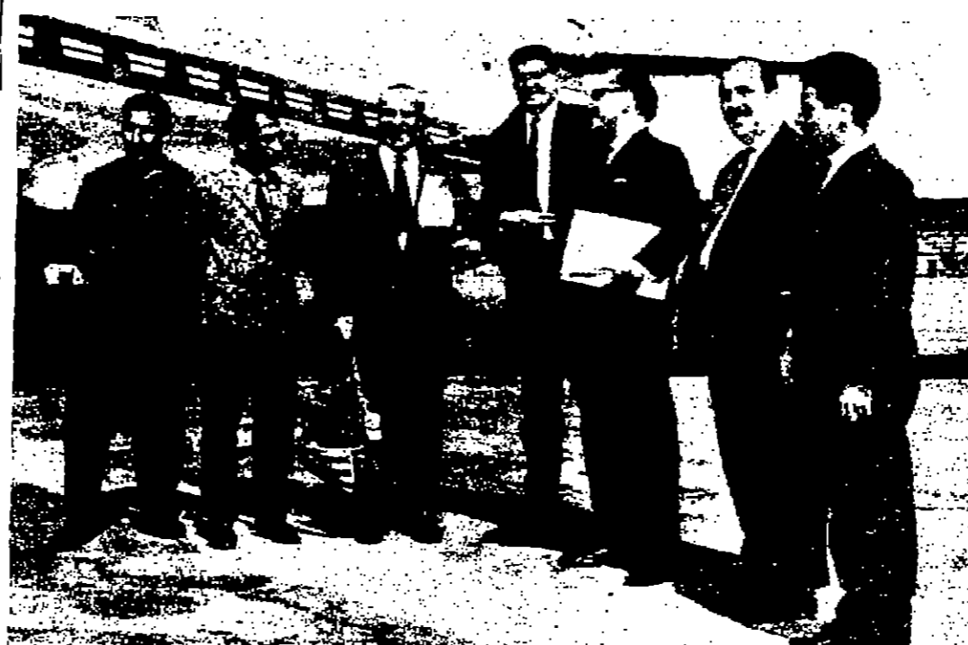
المفوض البريطاني لسد فطرته مطار عمان امس

عمان - استقبل دولة رئيس الوزراء ورئيس الوزراء في مكتبه امس المستر متشلور المفوض العام لوكالة